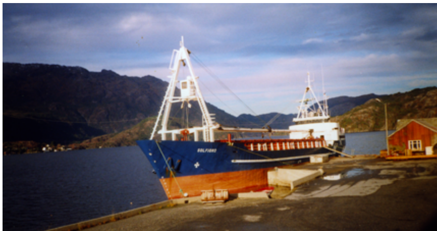
Solfjord ved eit sjeldsynt besøk på Utskot.

Då dei selde Solfjord i 2002 var oppdraget for Skretting slutt. «Gutane» gjekk på land, og vart der i fem år. Men tru ikkje at dei var uverksame.