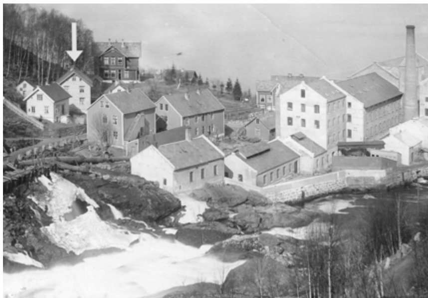
Tysse 1899. «Stamneshuset» er markert.