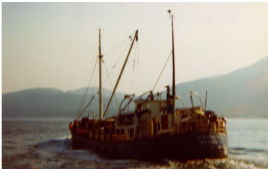
Vindenes lasta med fiskefôr og med hus på dekk. Glava på akterdekket.

Jørgensenkarane tok kontakt med Skretting i Stavanger, og dei vart einige om å gjera ein prøvetur med fôr. Dette vart starten på 22 år med fôrtransport langs heile kysten.