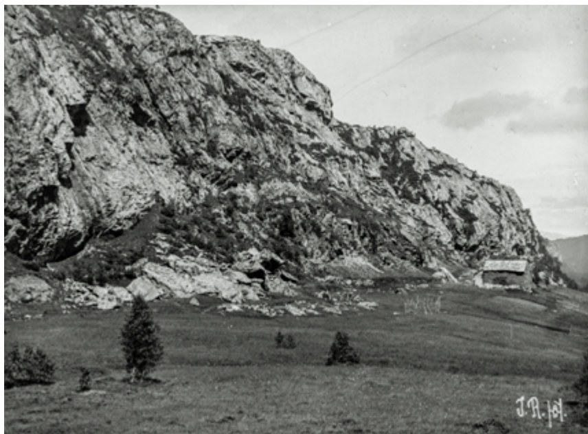
Bjergane 1908.

Bjergane ligg i utmarka til Ådlandsgardane i Fusa, og er felleseige. (Gardsnamnet Ådland finst både i Samnanger og Fusa). Plassen ligg like aust for Ådlandssetra. Jorda var god, flat og lettdriven, og Johan og kona fekk eit enklare liv.