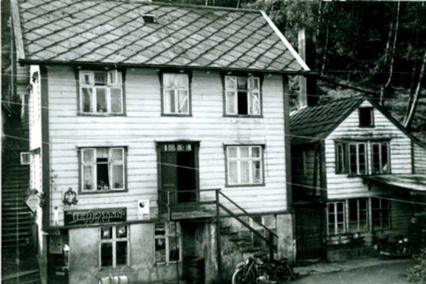
«Stamneshuset», «Foreningen» eller Handelslaget på Tysse. I det vesle bygget ligg bakeriet.

Då fabrikkjen brann, flytte begge Langelandfamiliene i Tyssebakken vekk, for å finna arbeid. Ytre Arna hadde ei konkurrerande tekstilbedrift, og etter brannen fekk fabrikkjen der nok å gjera. Dei kunne tilby arbeid til mange av dei arbeidslause frå Tysse. Ytre Arna var allereie eit stort samfunn, og der var det også mykje anna arbeid å få.