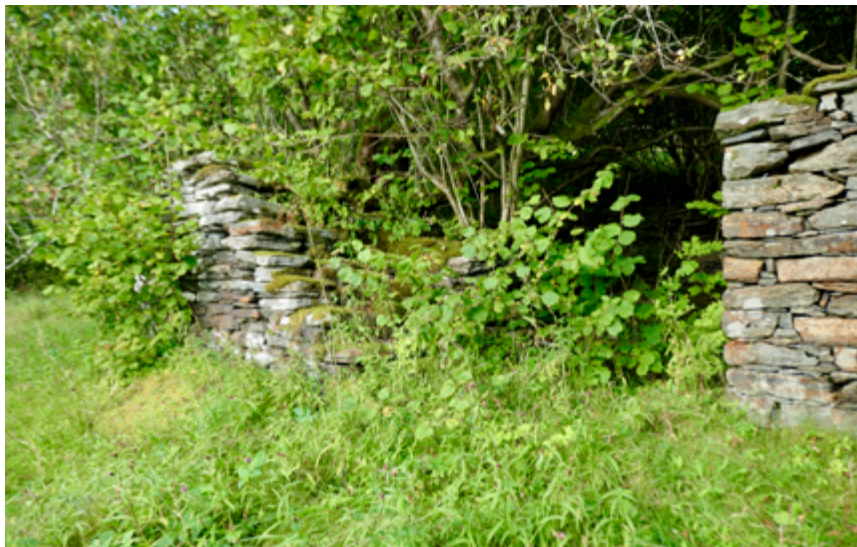
Solide murar i Skutevika gøymar mange minne.

til handelsmannen på Gaupholm, Brigt Brigtsen. Slik kunne dei føra samtaler frå kvar si side av fjorden, noko som sjølvstøtt resten av fjorden der ute òg fekk med seg. Det kunne i alle høve ikkje vera så hemmeleg, det dei snakka om.