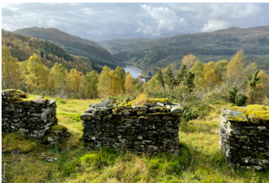
Tuftene står framleis att i Tøena. Djupt nede ser me Fiskevatnet.

Her skulle ein vera forsiktig kvar ein trødde, med store hol og steinar ein måtte svinga seg rundt, enkelte plassar ein smal sti der sauer og geiter hadde sin vandreveg.