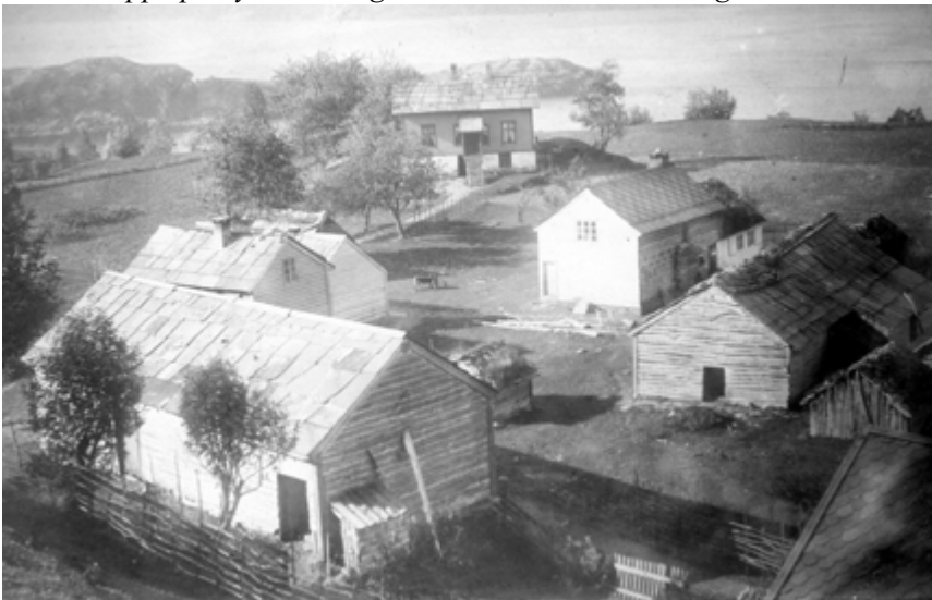
Oppe på Tysse om lag år 1900. Gurohuset i bakgrunnen.

På kvisten i Gurohuset var den eine skråveggen kledd med tjukk stiv papp, festa berre oppe og nede. Om hausten blæs det alltid så kraftig austavind der på Tysse. Store takheller klappa på taket i stormkasta, og pappen bula seg ut attmed senga mi, og small inn att til veggen. Eg vart vettskremd.