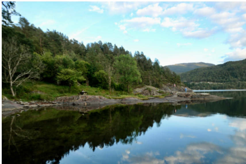
Skutevika i september 2022