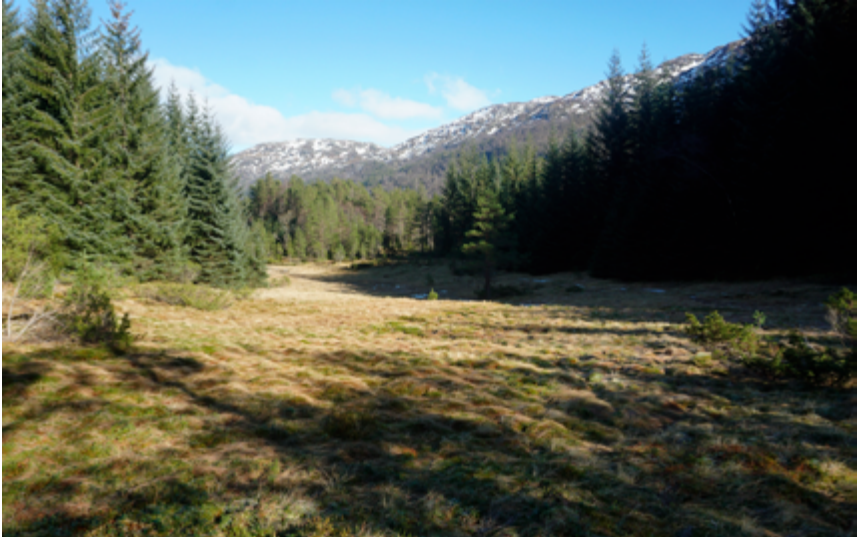
Bjergane i mars 2021.

ungdyr om våren, og hadde dei gåande i fjellet heile sommaren. Slikt driftefe må ha vore eit vanleg syn i fjella på den tida. Om hausten skulle dyra seljast, som livdyr eller slaktedy. Like nord for Bjergane ligg Vadet, eller Kjøpmannsvadet, der det i eldre tid var samling av driftefe, og der folk møtte opp for å kjøpa seg ei drektig kvige eller ku. Elles vart mykje av feet drive til byen for å seljast som slaktefe. For ein fehandlar må Bjergane må ha vore ein praktisk plass å bu.