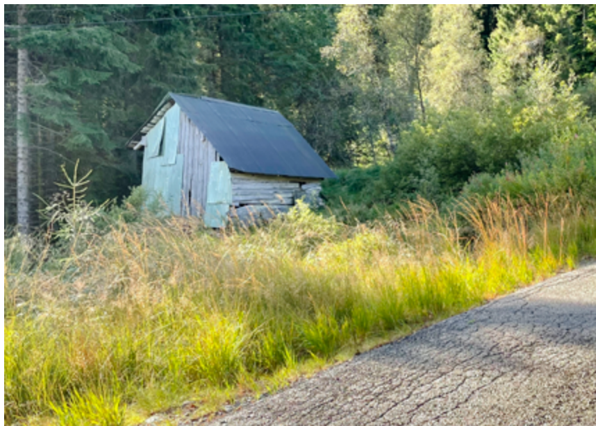
Løa står framleis ved vegen til Totræna, rett etter avkøyrsla til Solheim.

Merknad frå redaksjonen: Me har spurt i fangeleiren i Arna om russarane kan ha kome derfrå. Dei trur heller dei må ha kome frå ein leir i Åsane, der det var russarar i fangenskap.