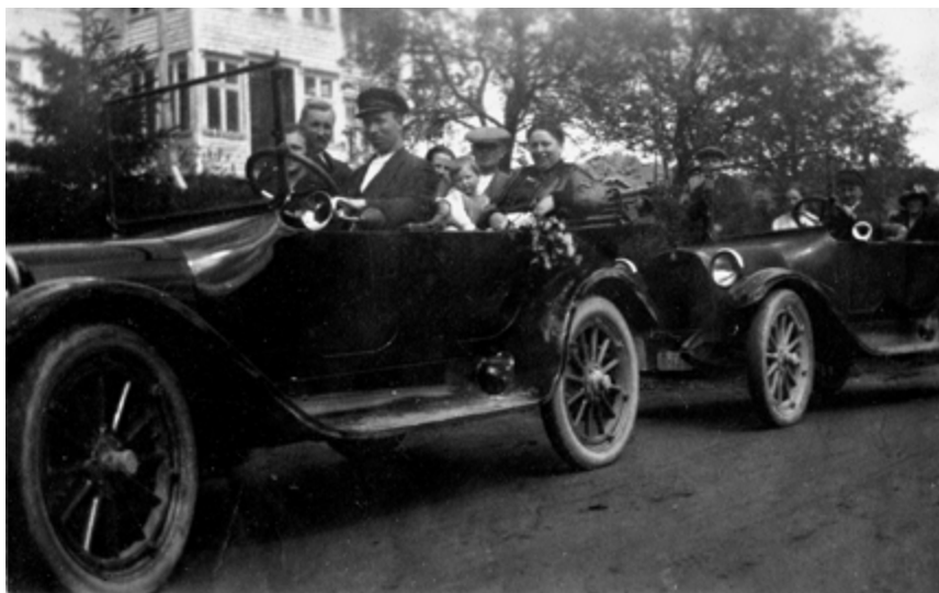
Dodge 30-35 med reg. nr. R84 (t.v.) var første bilen i Samnanger.

Eg vart så imponert over dei fine mønstera som gummihjula laga i den våte veg-grusen. I den skarpe svingen ut frå Tyssebrua og nedover var det plutselig vorte fire spor – dette gjekk over min forstand. Eg hadde berre sett kjerrer med to hjul.