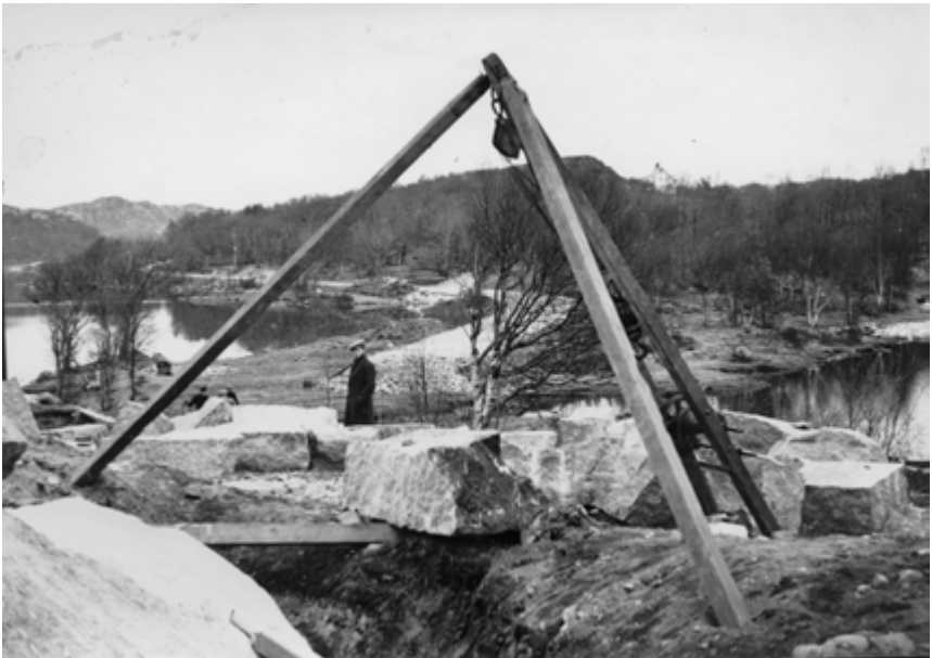
Steinbukken var ein stor og skrevande kar.

Dersom ladningen hadde vore vellukka, reiste fjellet seg, sundrista, opp i lufta og datt ned att på same staden. Då fekk skytebasen rosande blick av medarbeidarane. Det var ikkje alltid slik. Stundom for steinspruten høgt, og ned over liene, då var det ein fordel å arbeida i urudd mark.