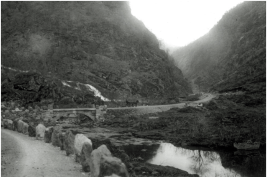
Flunkande ny veg forbi Mørkhølen. Foto: Jacob Deby, ca. 1900.

Hotel og elskværdige Værtsfolk. Hest og Vogn var kommen om Natten, og efter 1 Times Ophold bar det afsted rundt Bugten af Samnangerfjorden, passerede Tøsse Kl. 12.25. kjørte over Broen her, hvor Samnangerfossen styrter brusende i Havet, og fulgte Ælven opover til Frølandsvandet, videre opover Dalen med stadig stigning til toppen af Egedalsfossen. Storartet Natur og ser man her, hvor man i gamle Dage gik Stien ned Fjeldet ved siden af denne mægtige Foss, og hvor det gjaldt om ikke at være svimmel, thi enkelte Steder var kun Fodfæste paa Minebolte, indslaaet i Fjældvæggen, og glad var man naar Dalbunden var naaet. Efter 3½ Times Kjørsel fra Aadland ankom vi til Kvamshaug Hotel, hvor man befinder sig meget vel, og hvor prægtigt Fiskevand ligeved Hotellet. Derfra igjen Kl. 3½, og efter en Times Kjørsel med svag Stigning, naaede vi Høiden. Isen laa endnu paa Vander og Snefonner lige ved Veien. H. over H. ca. 1200 Fod. Her begynder Vandet at rinde ned mod Hardangerfjorden og Nedstigningen frembyder den mest storslagne Natur.