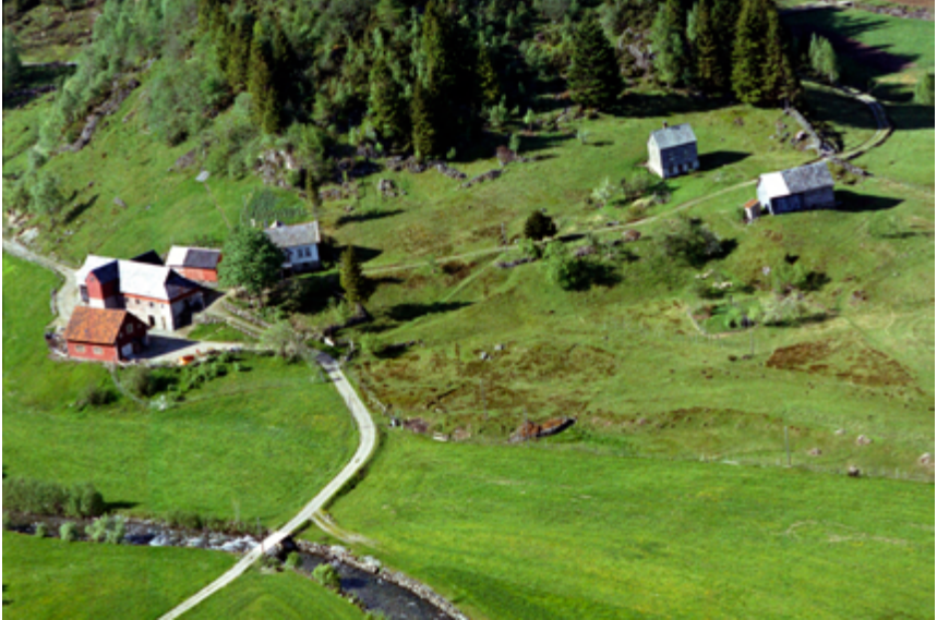
Nordbø i 1963.

Etter ei tid fekk me kjøpa ein gammal, utrangert traktor i Laksevåg kommune. Me fekk med plog og slepeharv. Det var ikkje hydraulikk den gongen, men med denne traktoren vart det likevel enklare. Det var bale med jarnhjul, som me hadde i starten, så etter ei stund fekk me tak i gummi hjul hos Mo auto. Me hadde ikkje pengar å betala med. Men «Mo'en» sa at det ordna seg nok.