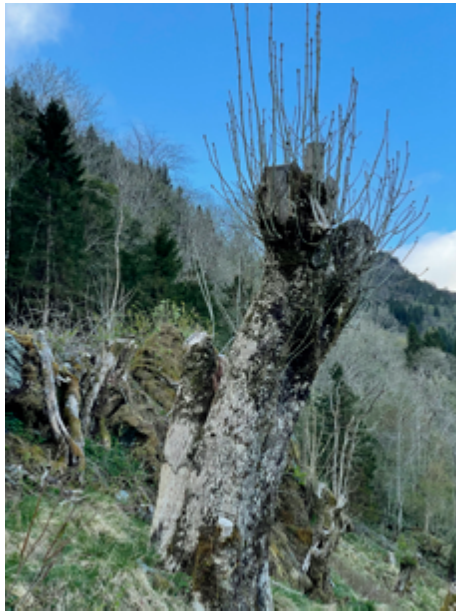
«Styvarar» av ask gav tilskot til fôret.

Me samla lauv, og me nytta skav. Skav var bork som me skava av greiner frå hegg, ask, alm eller rogn. Desse hadde me kappa om hausten i passe lengder. Når me om vinteren trong skav til dyra, tok me dei inn og vermde dei, for dei var ofte frosne. Så sat me med eit ljåblad som me heldt fast i eine enden med høgrehanda. Me beskytta handa med ei fille. Den andre enden av ljåbladet støtta me mot sengjekarmen. Eggen peikte vekk frå oss, og så heldt me greinbiten i venstre handa og skava av borken.