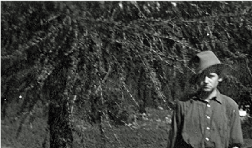
Forfattaren ikledd bus-hatt.