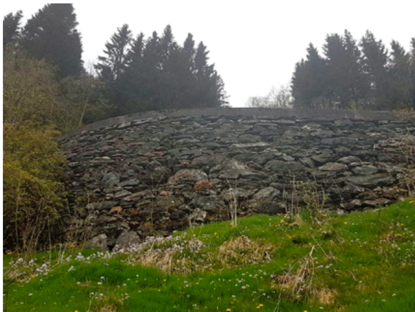
Eit flott stykke arbeid, mest som eit monument.

På ein liten flate på nedsida av vegen, vart det bygd opp ei smie. Mineborane laut kvessast heile tida, og det gjorde vegarbeidarane sjølv. Det var vel naturleg at det var verste regnversdagane som vart nytta til det arbeidet. Eg minnest at då eg kom frå skulen og hørde bankinga frå smia, stakk eg ofte innom og såg på arbeidet. Og så var det no moro å høyra på dei hardbarka «rallarane», dei hadde no eit og anna å læra frå seg dei, både av godt og gale. Kanskje fekk eg smaka litt snus og.