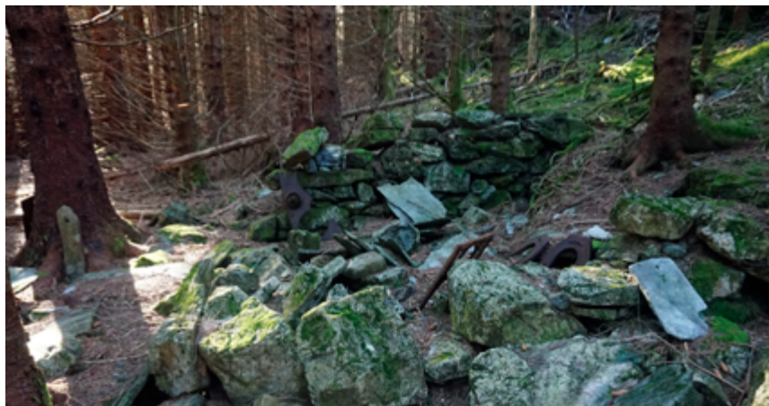
Husmannsplassen Bjergane i mars 2021.

Mange gardar i Noreg hadde fleire husmannsplassar. Ein husmann fekk kontrakt på å bruka plassen, oftast mot pliktarbeid på garden. Ei slik kontrakt kunne seiast opp, og då måtte husmannen forlata plassen. Dei som åtte jorda fekk mykje makt over dei «jordlause». I dag er desse plassane anten vortne eigne gardsbruk eller er fråflytte, og me kan ofte berre sjå ein mosegrodd haug med stein i terrenget. Kanskje ser me restane av ein omn i midten, som teikn på at det her har budd folk.