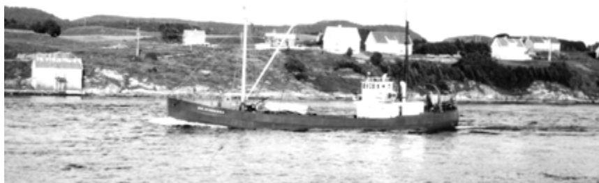
Vindenes i Karmsundet ved Haugesund

Til å begynna med leverte dei langs heile kysten frå Kvitøy, like utfor Stavanger, og heilt til Senja, rett sør for Tromsø. Anlegga var små, og fôret vart levert i små kvanta. Det vart mykje handtering av 50 kilos sekkar, og mange stopp på vegen. Folk spøkte med kva gale dei kunne ha gjort, som måtte halda på med slikt «straffarbeid».