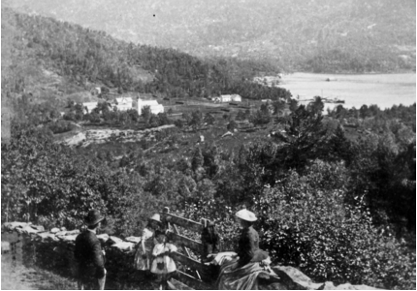
På kyrkjevegen sørover frå Ådland, 1889.

Her følgjer eit utdrag (noko omarbeidd) frå kapittelet som eg skreiv i boka «Samnanger kyrkje gjennom tidene», som vart laga til kyrkjejubileet i 2001: