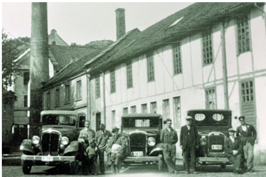
O. Langeland transport hadde tidleg tre bilar.