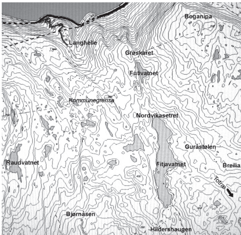
Kart over området rundt Fitjavatnet.

Men me må slett ikkje gløyma arbeidslivet når det gjeld bakgrunnen for setrastemna. Her rundt Fitjavatnet var sommarbeitet for kyrne frå fleire av samnangergardane: Gjerde, Haukaneset, Lauskar, Rødne, Steintveit og Nordvika hadde alle setrar rundt Fitjavatnet. På slutten av 1800-talet gjekk det meir enn 150 kyr på beite her oppe. Og vegen var ikkje svært lang til Breilia der Steinsland, Haga, Tveit og ”Tonæ” hadde sitt beite. Endå kortare var det til andre sida av vasskiljet der Langhelle hadde sine kyr.