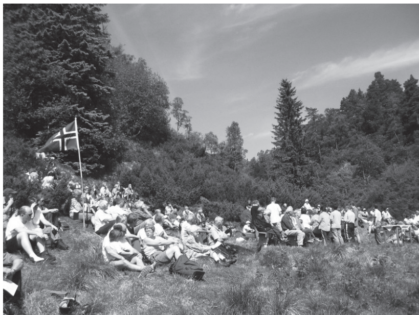
Jubileumsstemna i 2003

lom dei to møteøktene. Og så var det sjølvsagt høve til å sjå seg om etter eit kjærsteemne. Det er t.d. fortalt om ein godt tilårskomen enkjemann som etter eit møte sat på ein stein utanfor setra og song så vakkert han kunne, for gjera inntrykk på ei taus som òg var ferdig med den grønaste ungdomen.