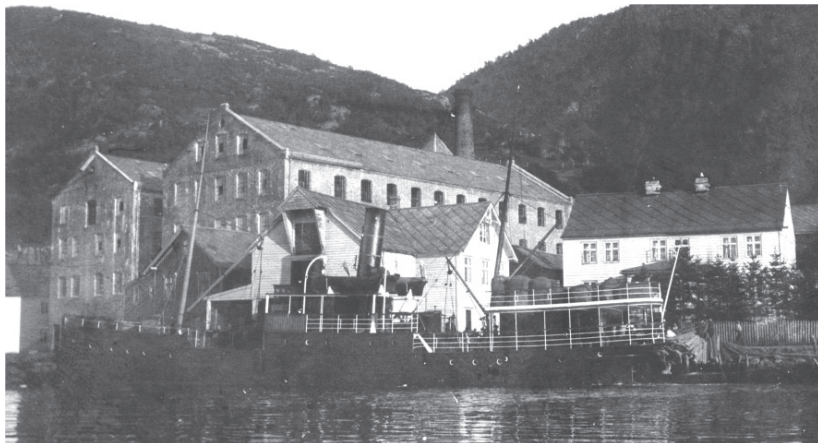
M/S Solstrand, som trafikkerte Tysse frå 1899 til 1934. Biletet er frå Tysse 1899.

Då eg var jente budde me i Barmen, og besteforeldra mine på morssida hadde ein gard på Milde. For å koma dit, gjekk me til Tysse, derfrå tok me båten til Os. Så følgde me Os-banen til Rå. Der hadde me ei tante og ein onkel. Og dit kom bestefar min og henta oss med hest og kjerre.