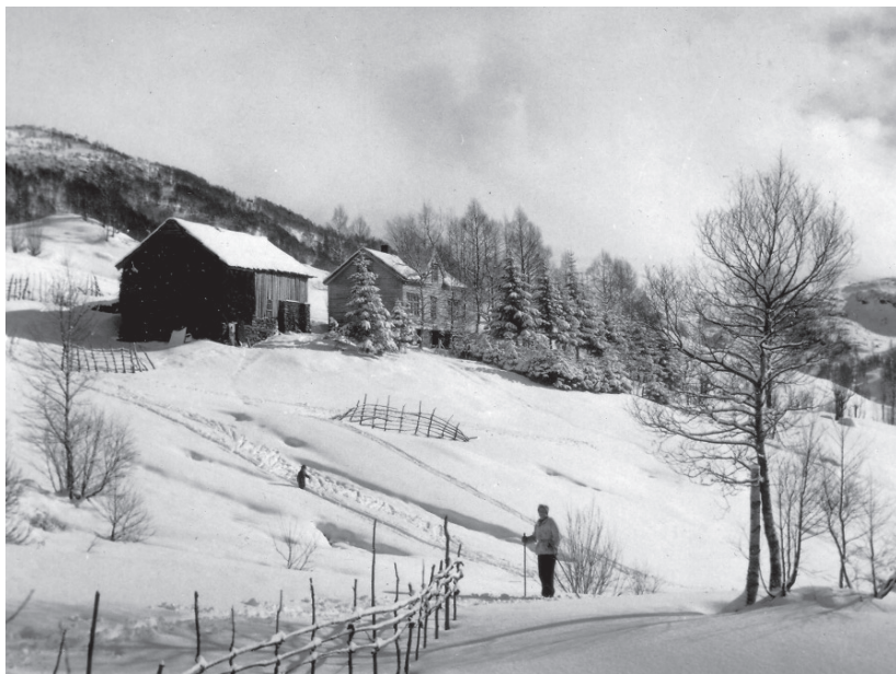
Påkestemming hos Sjurane i 1943. Familien Rasmussen begynte å feriera der i 1942. Seinare bygde dei seg hytte på Høyseter.