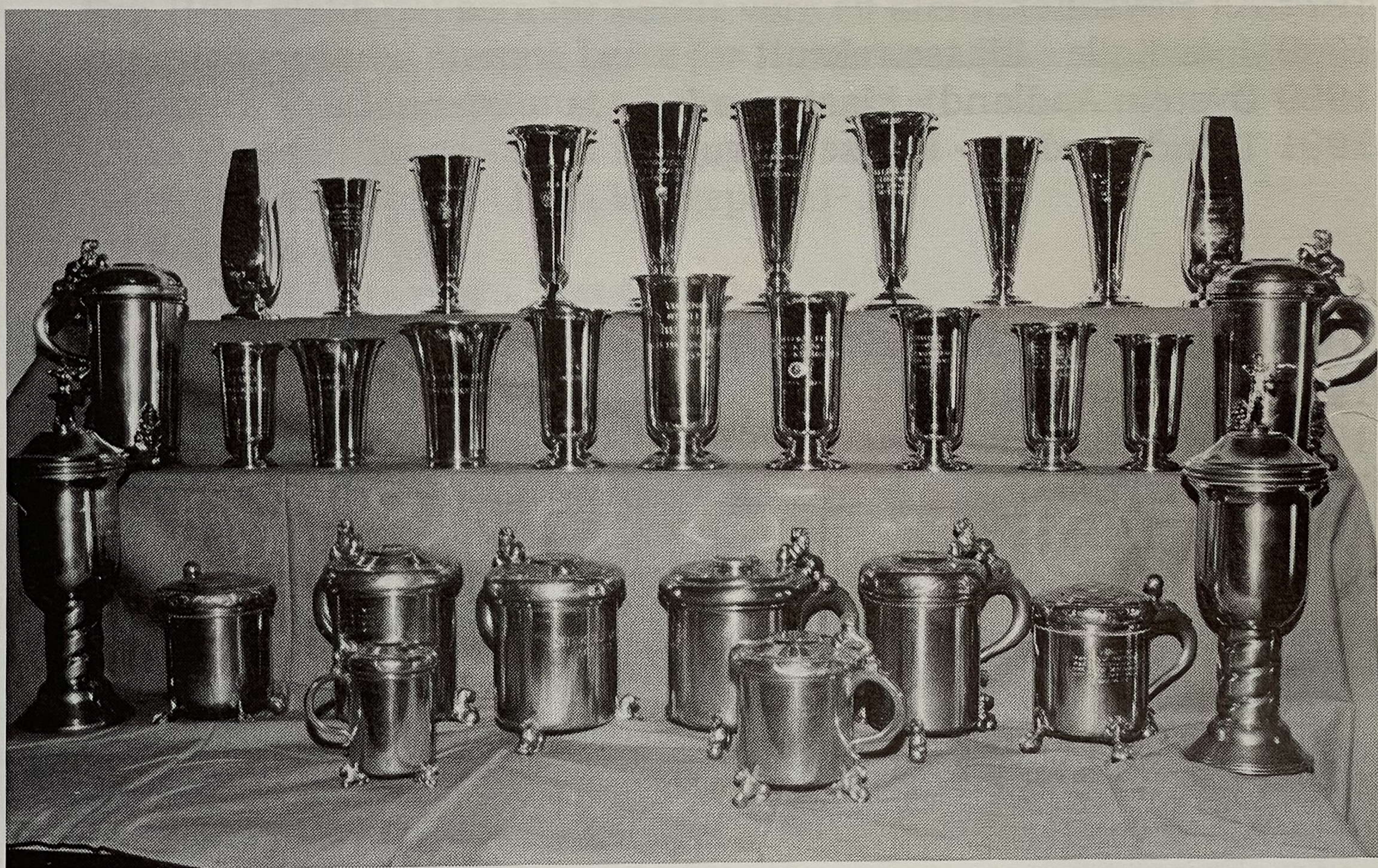
Ein del av Tysse skyttarlag si store og verdfulle premiesamling.