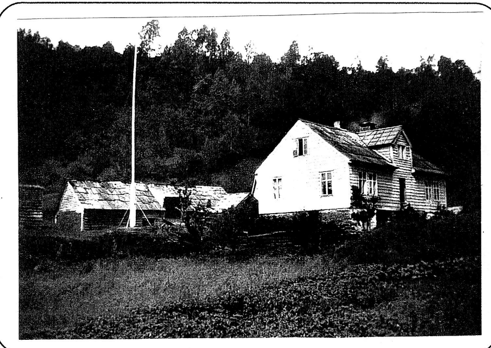
Kvernes, nedre (gnr. 15) fra 1920 - årene.