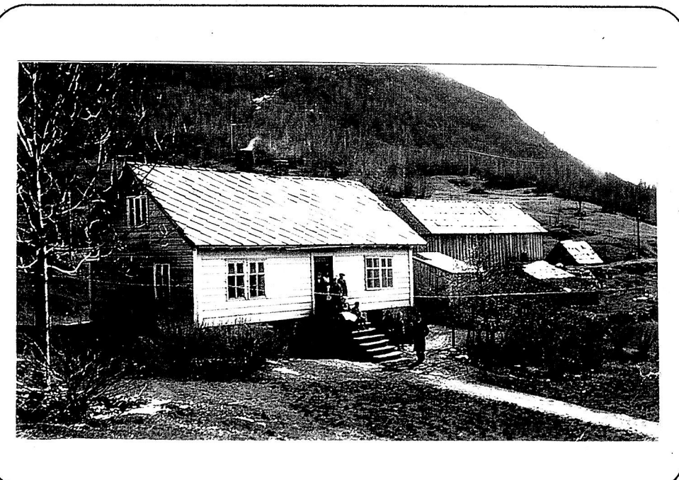
Gaupholm (gnr. 44), "Gamletnet" fra 1934 med bebyggelse på br. 4. Før utflytting ca 1903 stod husene på br. 1 til høyre på bildet - på begge sider av gårdsveien. (Se skissen)